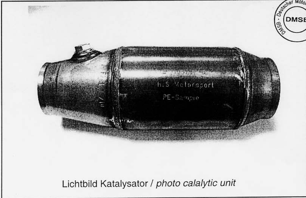
Lichtbild Katalysator / photo catalytic unit

Catalytic converter for exhaust gases: Jacket high-quality sheet metal, coating applied on metal supports.