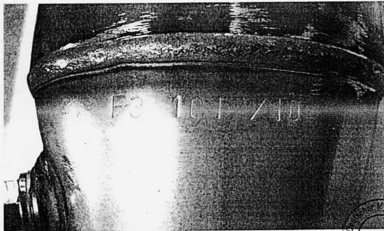
Kennzeichnung „F3 1012 / 10“ marking „F3 1012 / 10“